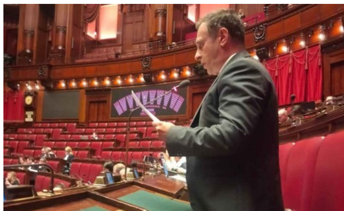
L'on. Franco Manes

Mentre oltre 650 valdostani convivono con l’epilessia, una patologia ancora stigmatizzata e poco tutelata, il Disegno di Legge per la loro protezione è fermo al Senato da oltre un anno. Il presidente nazionale di AICE è in sciopero della fame davanti al Ministero della Salute per chiedere l’approvazione urgente. In Valle d’Aosta, la politica deve uscire dal silenzio e agire: è il momento di dare dignità e diritti a chi soffre davvero